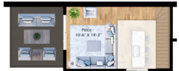
Mezzanine (177 pi 2 ) et terrasse privée sur le toit (175 pi 2 )