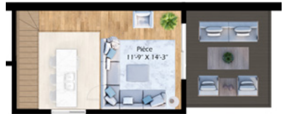
Mezzanine (190 pi 2 ) et terrasse privée sur le toit (175 pi 2 )