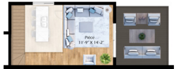
Mezzanine (190 pi 2 ) et terrasse privée sur le toit (175 pi 2 )